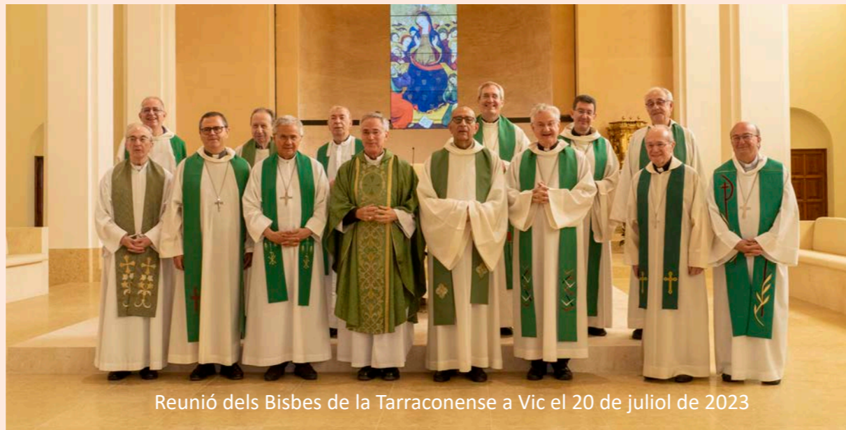
Reunió dels Bisbes de la Tarraconense a Vic el 20 de juliol de 2023

Q uan hom repassa l'activitat anual de l'Església a Catalunya es queda sorprès. Sovint el dia a dia ens centra en les coses petites i perdem de vista l'horitzó. La tasca que es fa cada dia per donar a conèixer la vida de l'Església ens permet agafar alçada amb tres paraules al cor: sorpresa, agraïment i ànim.